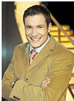
Der ehemalige Skirennläufer Armin Assinger ist Vortragender der diesjährigen „GastroDialoge“.