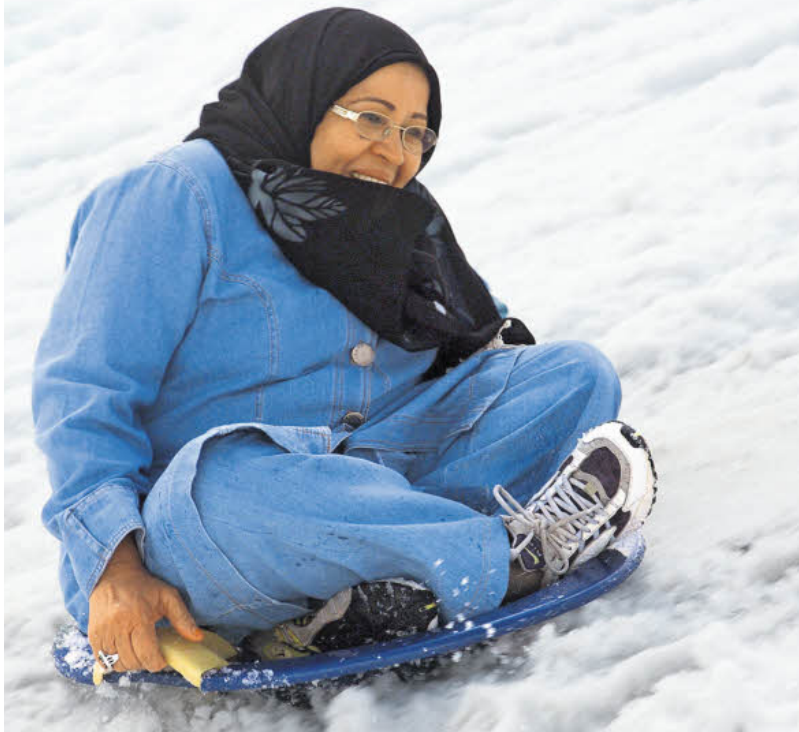
Die arabischen Gäste entdecken den Spaßfaktor Schnee.