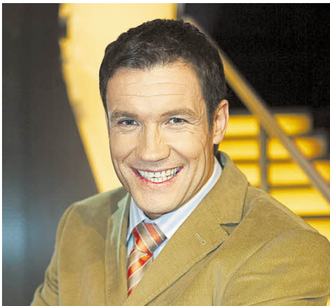
Ex-Skirennläufer und TV-Entertainer Armin Assinger hält den Gastvortrag.